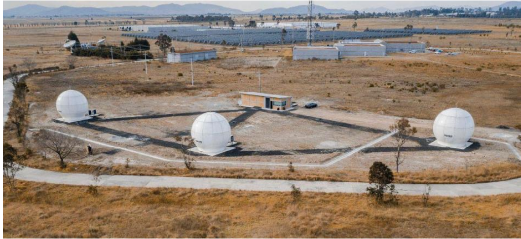
VISTA AEREA GENERAL DEL PROYECTO