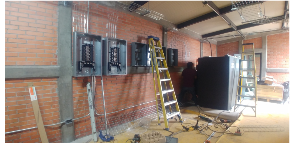
PROYECTO Y CONSTRUCCION DE LINEA DE MEDIA TENSION PARA ALIMENTACION DE TELEPUERTO (SHELTER Y ANTENAS), TRANSFORMADOR TIPO PEDESTAL Y ACOMETIDAS PARA CARRIER DE DATOS, INSTALACION DE DUCTERIA Y CABLEADO EN CUARTO DE CONTROL