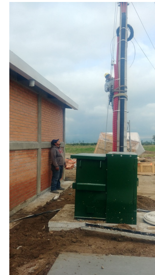
CALCULO, SUMINISTRO, INSTALACION Y PUESTA EN MARCHA DE PLANTA DE EMERGENCIA