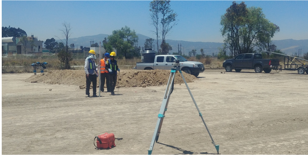
CONTROL TOPOGRAFICO PARA REPLANTEO DE PUNTOS X,Y,Z Y CONTROL DE NIVELES, CONSTRUCCION DE CANALIZACIONES Y REGISTROS