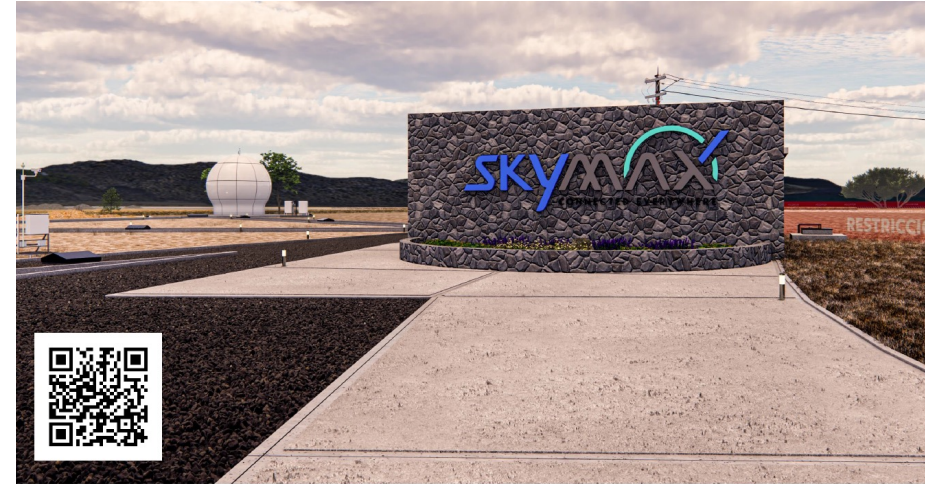
ESCANEA EL CODIGO QR PARA VISUALIZAR EL PROYECTO VIRTUAL